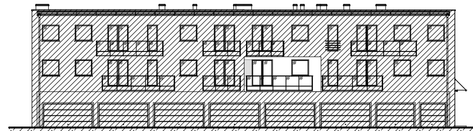
LOKAL OD UL. ŚNIADECKICH